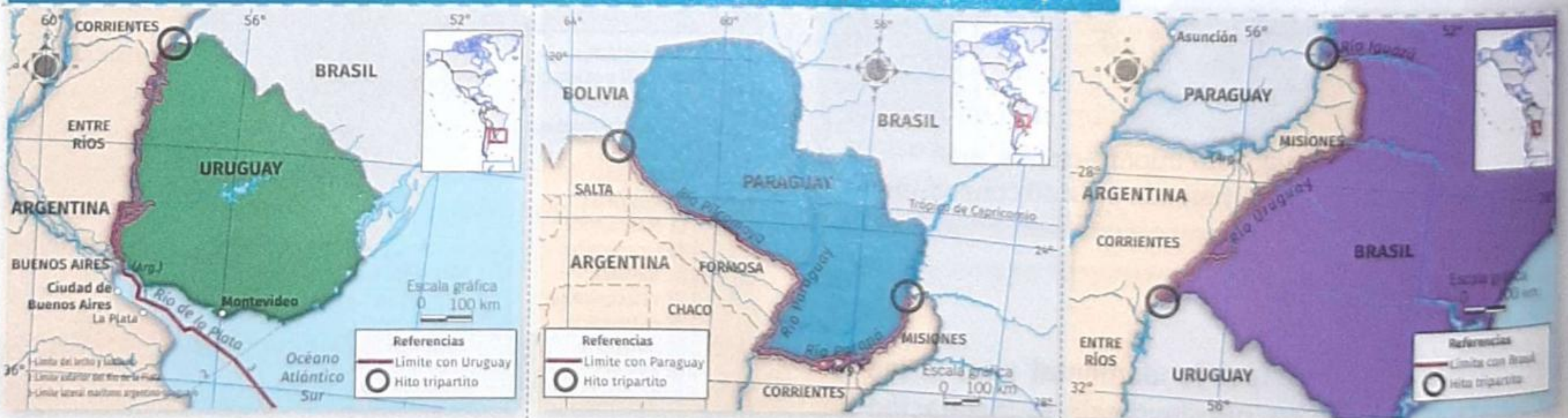
[FIG. 19] Trazado de los límites entre la Argentina y sus países limítrofes

Uruguay. El límite se definió sobre el río Uruguay y el Río de la Plata. En el primero, se usaron dos criterios: desde la isla Brasilera hasta el embalse Salto Grande se utilizó la línea media del río (igual distancia de ambas orillas), y, desde el embalse Salto Grande hasta Punta Gorda, la línea de vaguada (la línea de mayor profundidad del río). En el Río de la Plata, se estableció el límite externo con una línea imaginaria que une Punta Rasa (Argentina) con Punta del Este (Uruguay). Además, se acordó el uso común de las aguas, excepto cerca de ambas orillas.