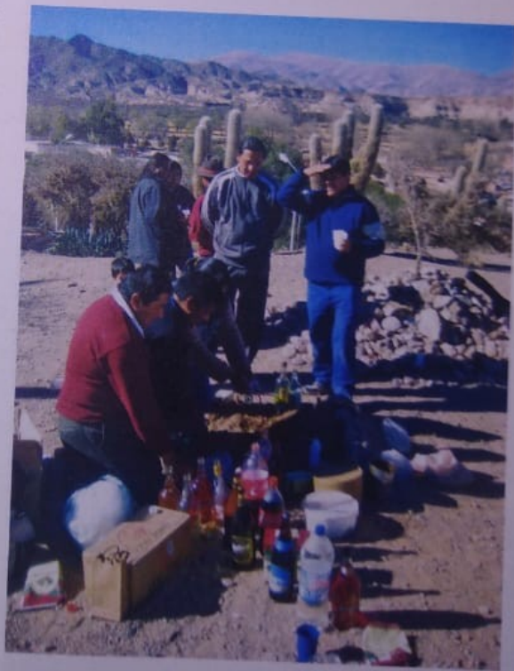
➤ Rendir ofrendas a la Pachamama forma parte de la cultura de las comunidades originarias del norte andino. Actualmente, el ritual se realiza en otras zonas del país, debido a las migraciones.

Reflexionar sobre el concepto de cultura nos ayuda a pensar que la cultura es una producción de los seres humanos en su vida social , y está en constante cambio. Al mismo tiempo, los seres humanos son producto de esa cultura. Así, podemos afirmar que no existe el “humano natural”, sino que, como todos somos integrantes de una sociedad, formamos parte de la cultura. Crecemos y nos educamos en ella y, a la vez, contribuimos a construirla y modificarla.