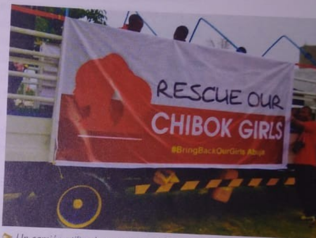
► Un camión utilizado por los manifestantes de Nigeria promueve en las redes sociales la campaña "Devuelvan nuestras niñas".

Reconocer, comprender y aceptar lo diferente de nosotros, nos vuelve más sensibles frente al mundo y ayuda a la convivencia pacífica.