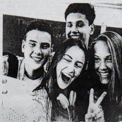
El hábito de mirarse al espejo o de tomarse fotografías permite a los jóvenes apreciar los cambios corporales y construir las nuevas imágenes de sí mismos.