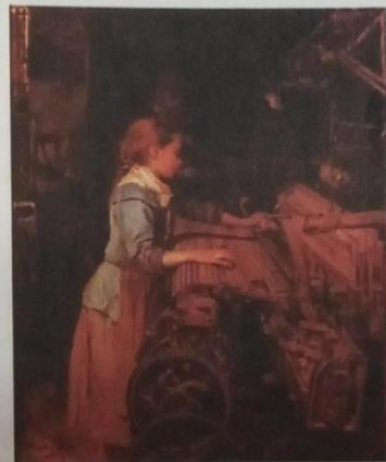
► La pequeña obrera, de Joan Planella y Rodríguez, 1889. La composición del cuadro representa la cotidianidad del trabajo infantil en las fábricas textiles del siglo XIX en Cataluña.

crecimiento, para que aprendan a asumir responsabilidades y para su integración a la sociedad de un modo digno. El reconocimiento de los derechos del niño respecto de la dignidad, iguales a los del adulto, es un proceso reciente en el mundo. En 1959 se dio el primer paso, cuando la Organización de las Naciones Unidas (ONU) redactó la Declaración de los Derechos del Niño . Sin embargo, sus resoluciones no fueron obligatorias hasta la sanción de la Convención sobre los Derechos del Niño , en 1989, que fue ratificada hasta el momento por 194 países. La ratificación significa que compromete a los Estados a reconocer derechos básicos, como asegurar su vida en plenitud, libres de hambre, miseria, abandono y malos tratos, a un ambiente seguro, a la educación, a tiempo de ocio, a la asistencia sanitaria, a la posibilidad de participar de acuerdo con su edad en la vida social, económica, cultural y política de su país.