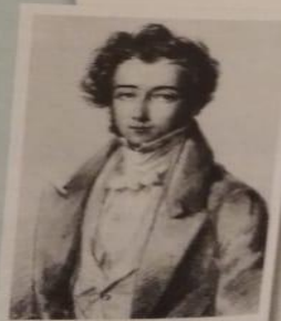
➤ Alexis de Tocqueville fue un pensador francés que vivió en el siglo XIX.

Alexis de Tocqueville, La democracia en América , Madrid, Sarpe, 1984.