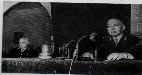
Los generales Levingston (derecha) y Lanusse (izquierda) al exigir la renuncia de Onganía.

En el ámbito político, el gobierno de Levingston no se diferenció demasiado del de su predecesor. Decidido a profundizar la Revolución Argentina, continuó con las medidas de proscripción y no se propuso encauzar una apertura política. Pero las Fuerzas Armadas estaban sumamente debilitadas y ni el giro económico ni la represión pudieron controlar la situación. Esto favoreció un acuerdo entre Perón y el radicalismo, que se concretó en la construcción de una convergencia de fuerzas políticas