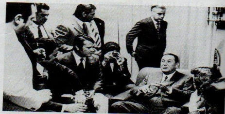
Perón, a principios de los 70, en Madrid, reunido con dirigentes peronistas como Rucci, Cafiero y H. Iglesias.

El 22 de marzo de 1971, el general Alejandro Agustín Lanusse comenzó su presidencia reemplazando al destituido Levingston. El nuevo presidente de facto asumió en un contexto nacional en el que la movilización popular ya desbordaba al régimen militar. Por lo tanto, Lanusse se vio obligado a preparar la transición hacia el retorno de la democracia. Esta transición no podía hacerse de otra manera que no fuera levantando la proscripción del peronismo, tan reclamada por sectores sindicales y guerrilleros. Si bien los militares ya no podían mantener prohibido al Partido Peronista, encontraron la manera de evitar la candidatura del propio Perón. Para ello impulsaron una cláusula por la cual los candidatos debían encontrarse en el país desde agosto de 1972. Perón, que estaba en el exilio, no cumplía con ese requisito. Por otra parte, también se implementó la ley de ballotage (o segunda vuelta), según la cual, si ningún partido alcanzaba el 50% de los votos, debía hacerse una segunda elección. Los militares esperaban, así, impedir el triunfo del peronismo.