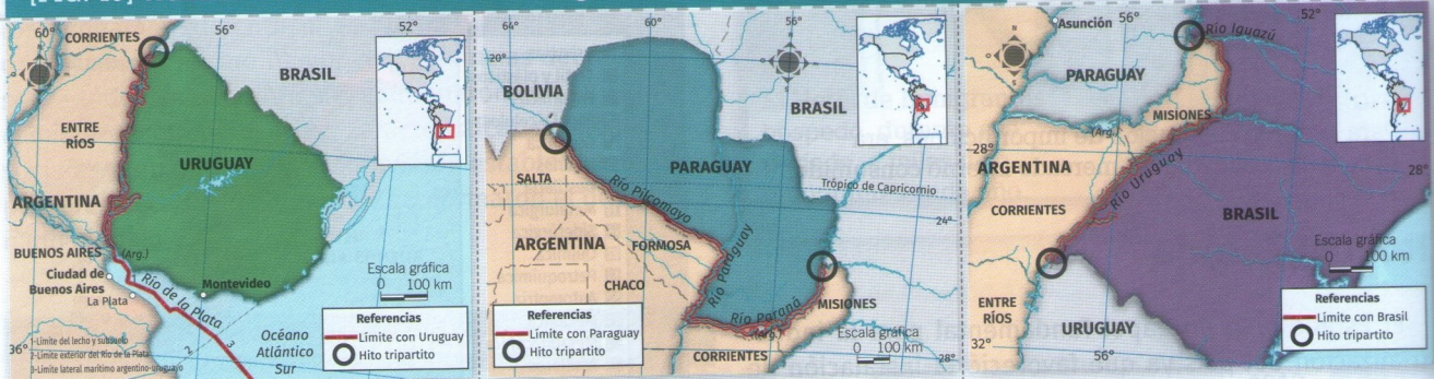
[FIG. 19] Trazado de los límites entre la Argentina y sus países limítrofes

Uruguay. El límite se definió sobre el río Uruguay y el Río de la Plata. En el primero, se usaron dos criterios: desde la isla Brasilera hasta el embalse Salto Grande se utilizó la línea media del río (igual distancia de ambas orillas), y, desde el embalse Salto Grande hasta Punta Gorda, la línea de vaguada (la línea de mayor profundidad del río). En el Río de la Plata, se estableció el límite externo con una línea imaginaria que une Punta Rasa (Argentina) con Punta del Este (Uruguay). Además, se acordó el uso común de las aguas, excepto cerca de ambas orillas.