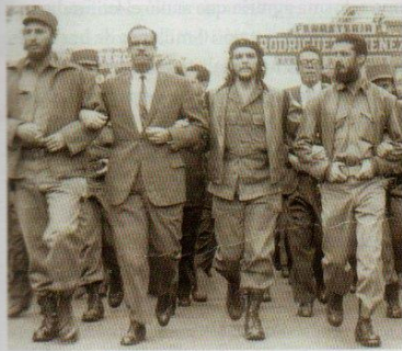
Fidel Castro (primero desde la izquierda) y Ernesto Guevara (tercero) encarnaron dos líneas diferentes sobre el rumbo del socialismo cubano. El primero impulsó la inserción del país en el bloque comunista, para salvar a la isla del acoso estadounidense. Guevara, en cambio, buscó asegurar una vía revolucionaria independiente.

El primer paso radical del gobierno revolucionario fue la Ley de Reforma Agraria, que expropió latifundios para repartir la tierra y prohibió su propiedad en manos de extranjeros. Esto era un desafío a las inversiones azucareras estadounidenses. En 1960, la estatización de la economía continuó con la nacionalización del petróleo. Ante la interrupción de las ventas por parte de las refinerías anglosajonas, Cuba encontró en la URSS un proveedor barato de combustible, así como de tecnología, créditos, equipos y armas. Las compañías estadounidenses en la isla, sin embargo, se negaron a refinar petróleo ruso. El gobierno estadounidense, por su parte, suspendió la cuota azucarera. En este contexto, Fidel Castro nacionalizó todas las empresas extranjeras (refinerías de Standard Oil, Shell y Texaco; bancos estadounidenses; trapiches; mi-