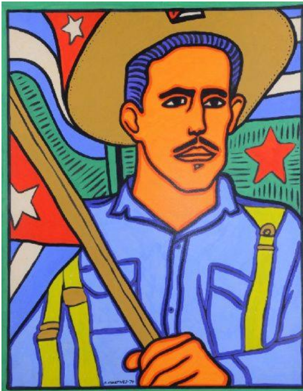
“El abanderado” de Raúl Martínez

En el contexto revolucionario, el trabajo del artista debía servir para reafirmar el triunfo de lo que se definiría como “hombre nuevo”, exaltando su identidad en el espíritu de compromiso que la construcción de una nueva nación requería. El Arte y Política siempre estuvieron vinculados, ya que se utilizaba el Arte para fortalecer el poder de la Revolución y hacer conocer sus propósitos y llegar a más personas. Raúl Martínez, artista cubano (1927-1995), fue importante en este proceso.