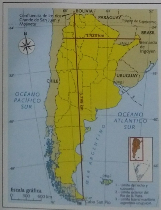
► Puntos extremos de la Argentina, parte continental americana.

La Argentina limita al norte con Bolivia y Paraguay; al sur, con Chile y el océano Atlántico Sur; al este, con Brasil, Uruguay y el océano Atlántico Sur; y al oeste, con Chile. El perímetro de sus fronteras internacionales, solamente en la porción continental americana, se extiende a lo largo de aproximadamente 15.000 km. De este total, 9.376 km corresponden a los límites con cinco países, y 5.117 km al litoral fluvial del Río de la Plata y el mar Argentino.