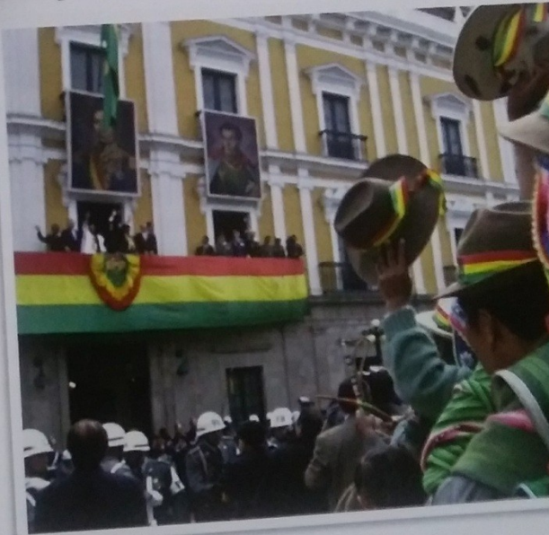
► Comunidad de campesinos. En 2006 saludan al presidente electo de la República de Bolivia, Evo Morales, en el balcón del Palacio presidencial.

En la mayoría de estos países, sus instituciones de gobierno buscan lograr que los intereses y deseos de las diversas comunidades se encuentren representados en cada una de las decisiones públicas. A este tipo de Estados se los define como Estados multinacionales o plurinacionales .