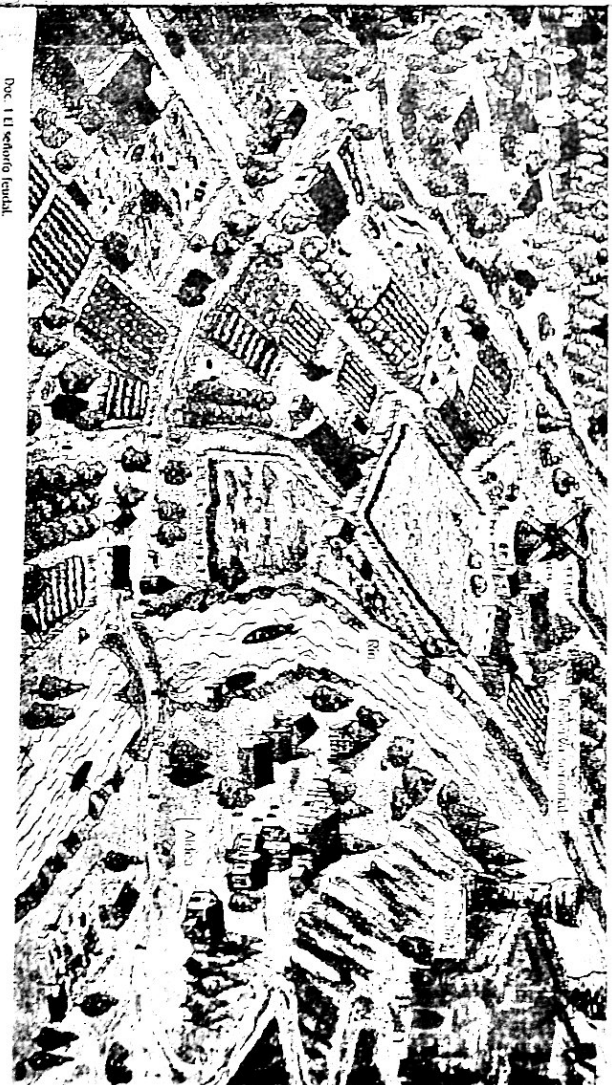
Doc. 1 El señorío feudal.

Como consecuencia de esta debilidad de la monarquía, los nobles consideraban al rey como un primus inter pares , lo que significa "primero entre iguales".