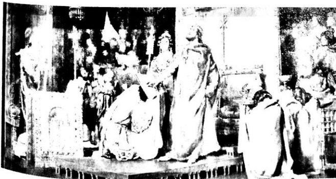
Conversión de Recaredo al cristianismo, como fue imaginada por el pintor Antonio Muñoz Degram.

La Iglesia no solo mantuvo la forma de organización del Imperio romano. También conservó y transmitió la cultura clásica . Las iglesias y los monasterios medievales tenían grandes bibliotecas donde el clero leía, estudiaba y copiaba gran cantidad de libros. Además, si bien el latín tendió a desaparecer como lengua de uso cotidiano, el clero continuó usándolo tanto para la escritura de documentos como para recitar los sermones y las misas.