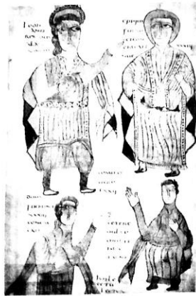
Representación de un noble godo y su séquito.

En un principio, los germanos comenzaron a ingresar al territorio imperial en grupos pequeños en busca de tierras y de un lugar más seguro para asentarse. Por ello, el Imperio los incorporó fácilmente y les entregó tierras a cambio de que sirvieran en el ejército. Pero, a partir de la primera mitad del siglo V, los germanos comenzaron a invadir masivamente el territorio del Imperio romano de Occidente, empujados por la invasión de otros pueblos venidos de Oriente, como los hunos.