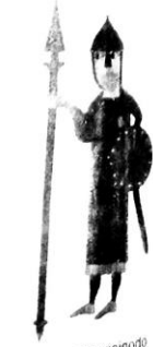
Guerrero visigodo armado para la guerra.