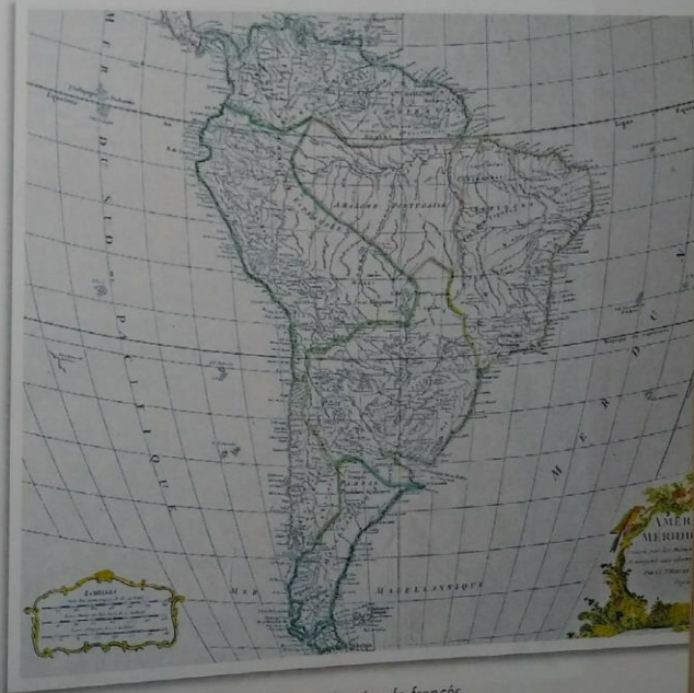
► Mapa de América del Sur realizado por el geógrafo francés Robert de Vaugondy en 1750, en el que se marcan distintos ríos, pueblos y detalles topográficos que se conocían en ese momento.

Sin embargo, fueron las continuas incursiones de expediciones de franceses y holandeses en la costa atlántica americana, lo que decidió al Imperio portugués a desarrollar un proceso de colonización con el fin de asegurar el dominio en las tierras americanas y evitar que lo tuvieran sus competidores.