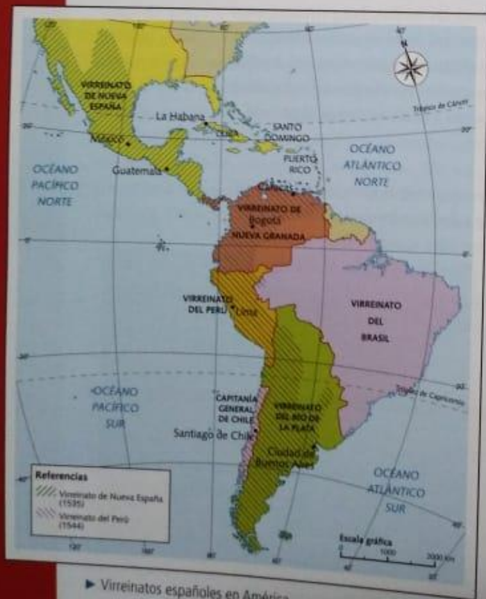
► Virreinos españoles en América.

El coatequil , en México, y la mita , en los Andes, obligaban a los indígenas a trabajar en las minas durante varios meses al año, sin que importara que vivieran cerca o lejos de las zonas mineras. Las condiciones de trabajo eran muy precarias y muchos morían antes de volver a sus comunidades.