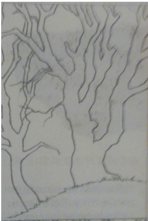
A) SOLO EL CONTORNO

HAY QUE TRABAJAR LINEAS RECTAS Y CURVASREALIZAR UN DIBUJO SIMPLE, SI QUIEREN PUEDEN COPIAR EL MISMO.Y SOBRE DICHO DIBUJO REALIZAR COMO FONDO LINEAS RECTAS Y SOBRE EL DIBUJO COLOCAR LINEAS CURVAS, PRESTANDO ATENCIÓN CON QUE SE CONECTEN CON LAS LINEAS RECTAS DEL FONDO.