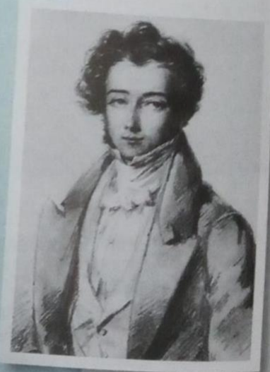
➤ Alexis de Tocqueville fue un pensador francés que vivió en el siglo XIX.

Alexis de Tocqueville, La democracia en América , Madrid, Sarpe, 1984.