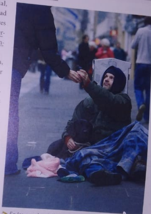
➤ En las grandes ciudades del mundo hay personas que nunca tuvieron una vida digna o la perdieron.

derechos humanos, además de ser un deseo o programa de objetivos a cumplir, es un punto de llegada actual que tiene una larga historia de luchas con avances y retrocesos para lograr su reconocimiento formal en leyes, tratados y en el derecho internacional. Por ser el resultado de luchas sociales, su formulación no está cerrada, es dinámica, y en el futuro podría ampliarse si fueran reconocidas otras formas de discriminación que hoy no se advierten así.