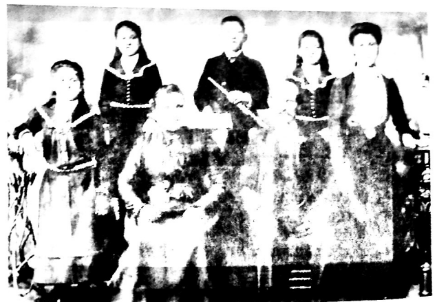
▲ Fotografía de 1905 que muestra inmigrantes italianos en la