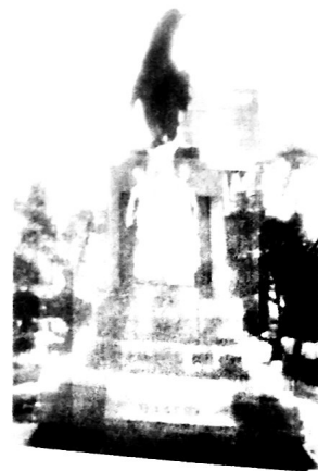
▲ Estatua del general Belgrano en Santiago del Estero

Podemos definir a la Historia como una ciencia social , que estudia el pasado por medio de distintas fuentes . Decimos que es una ciencia porque sigue una metodología determinada y analiza sistemáticamente los hechos. Y decimos que es social porque su objeto de estudio son las personas en sociedad.