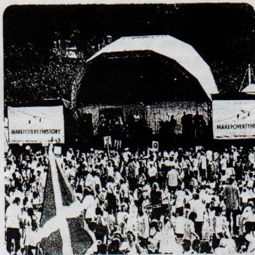
El consumo de productos culturales, como los recitales de música, brinda a las personas la oportunidad de autorreconocerse.

Desde esta perspectiva, son determinadas circunstancias las que van construyendo la identidad y, por lo tanto, cuando esas circunstancias cambian, la identidad se puede ir modificando. Por ejemplo, en un momento de su vida, una persona llamada Amanda podría decir: "Mi nombre es Amanda, soy de La Rioja, estudiante de segundo año, hincha de Boca y jugadora de fútbol".