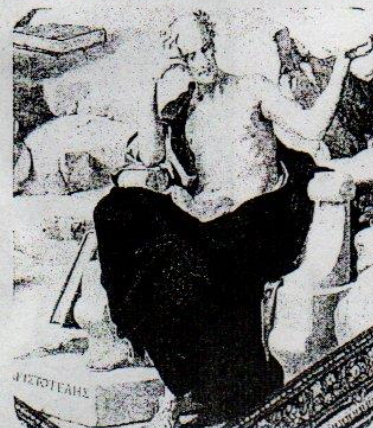
Aristóteles, según el detalle de un fresco del Museo Vaticano. A este filósofo se atribuye la formulación del principio de identidad.

En las páginas siguientes examinaremos esos tres puntos.