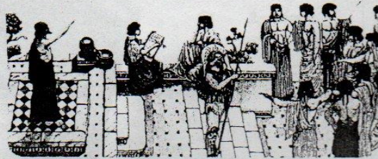
En las asambleas atenienses se resolvían las cuestiones relacionadas con la comunidad.

Desde mediados del siglo XX, la ciudadanía es vista como un conjunto de prácticas que le permiten a alguien ser miembro de una sociedad. Y los ciudadanos pueden realizar esas prácticas o acciones porque se les han reconocido una cantidad de derechos. A través de las acciones y los derechos, logran influir en las decisiones políticas. En resumen, ser ciudadano o ciudadana es poseer iguales derechos , tener conciencia de ellos y poder ejercerlos; participar en la construcción y transformación de la sociedad para crear las condiciones de igualdad en las que todos puedan ser efectivamente ciudadanos, y sentirse parte de una comunidad.