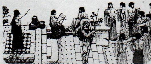
En las asambleas atenienses se resolvían las cuestiones relacionadas con la comunidad.

Desde mediados del siglo XX, la ciudadanía es vista como un conjunto de prácticas que le permiten a alguien ser miembro de una sociedad. Y los ciudadanos pueden realizar esas prácticas o acciones porque se les han reconocido una cantidad de derechos. A través de las acciones y los derechos, logran influir en las decisiones políticas. En resumen, ser ciudadano o ciudadana es poseer iguales derechos , tener conciencia de ellos y poder ejercerlos; participar en la construcción y transformación de la sociedad para crear las condiciones de igualdad en las que todos puedan ser efectivamente ciudadanos, y sentirse parte de una comunidad.